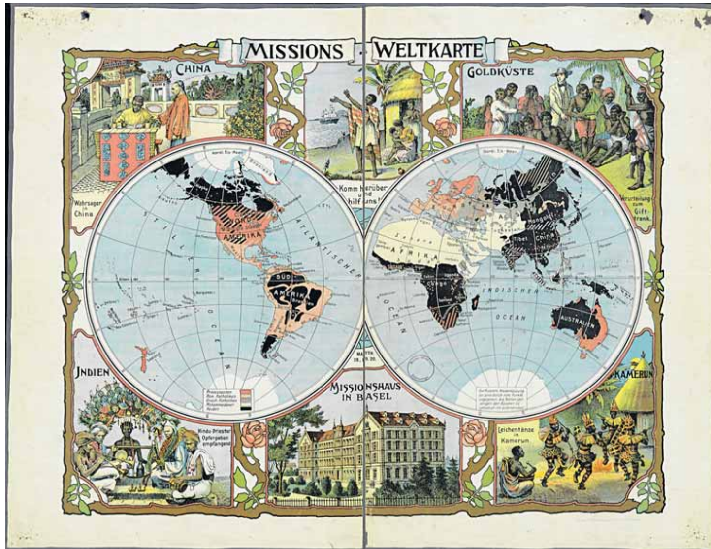
Carte des missions, vers 1890. La compétition missionnaire était parfois vive sur le terrain.

Sans s'en rendre compte, les missions préparent alors le terrain pour une colonisation massive?